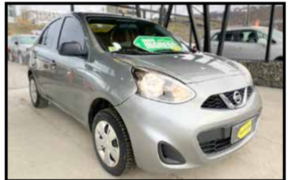
NISSAN MARCH 2017 KM 45000