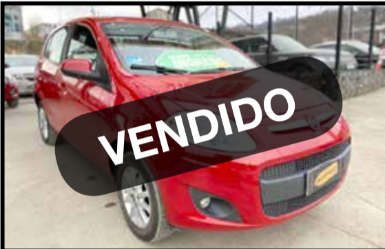
FIAT PALIO ATTRACTIVE 2017 KM 20000