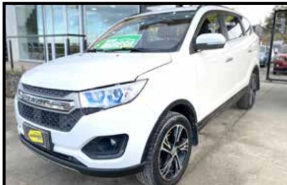
LIFAN MYWAY 7 ASIENTOS 2019 KM 23000