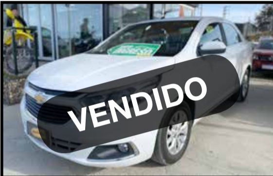
CHEVROLET COBALT AT 2019 KM 45.000

DESCUENTOS ESPECIALES EN ESTOS SELECCIONADOS Y MUCHO MAS!