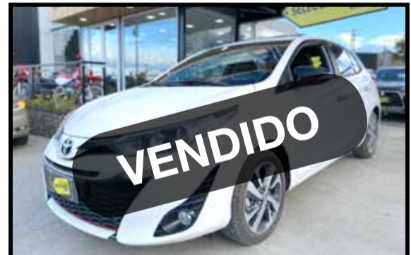
TOYOTA YARIS S 2022 0 KM